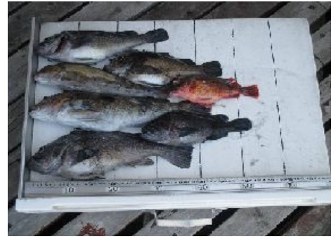
5/4 (木) Sanpe 淡路さん アイナメ、ソイ、カサゴ - 天王沖