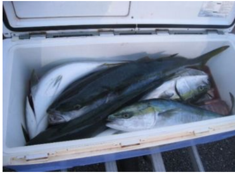
5/18 (木) 魚神丸 山本さん ワラサ - 本荘沖