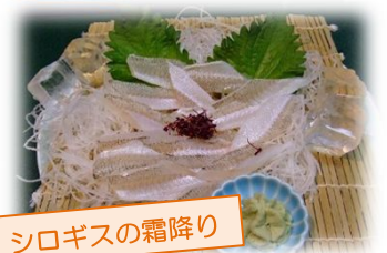
シロギスの霜降り