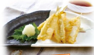
シロギスのてんぷら

クセの無い上品な白身のシロギスは、王道のてんぷらや皮付きの霜降りになると絶品です。その他サクサクのフライにするのもオススメです。数釣りが楽しめるシロギスですので、色々なレシピでシロギスのフルコースを堪能しましょう。