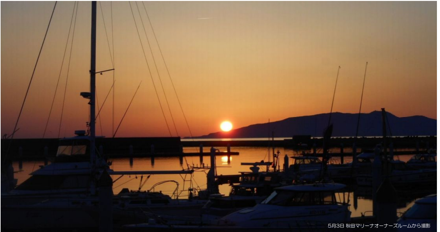
5月3日 秋田マリーナオーナーズルームから撮影

～ Enjoy Your Marine Life Around The Sea-Area Lat. 40° N ～