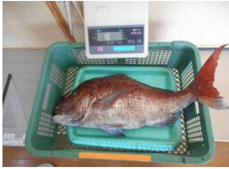
5/17 (水) 遊遊族 加藤さん マダイ - 塩瀬崎